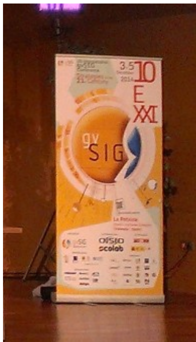
Figura 1. Ejemplo de cartel colocado en el interior del recinto.