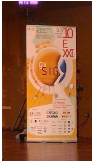
Figura 1. Ejemplo de cartel colocado en el interior del recinto.