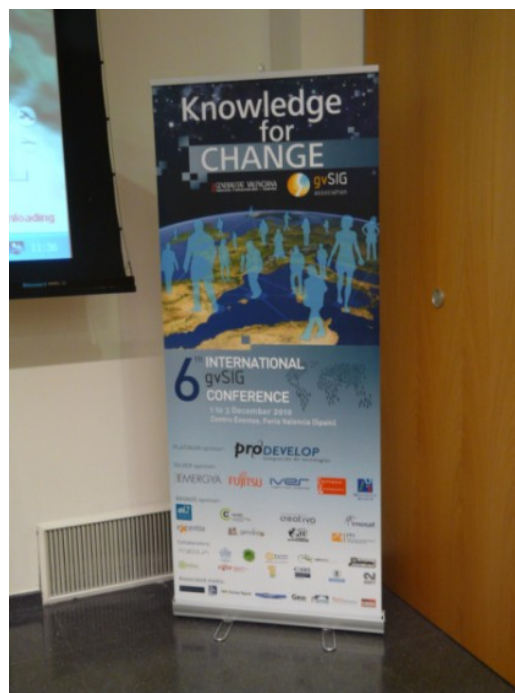
Figura 2. Ejemplo de cartel informativo (Roll-Up) que se colocará en los distintos eventos.