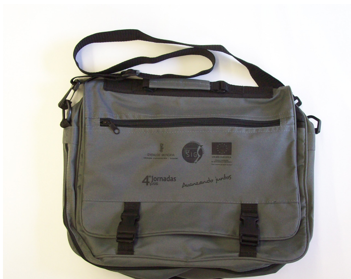
Figura 4. Bolsa con la documentación oficial entregada a los asistentes inscritos.