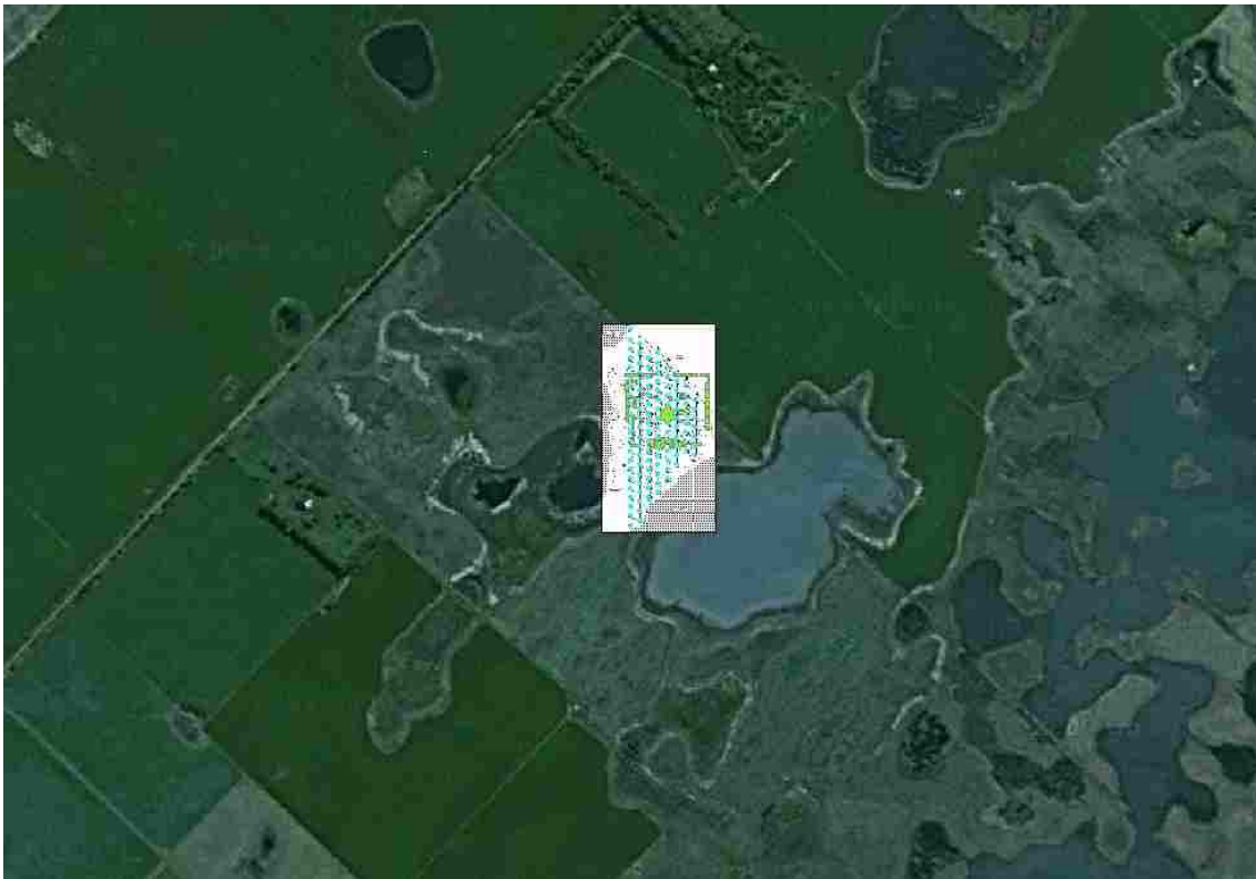
Figura 2 : Transectas y puntos de recogida de materiales