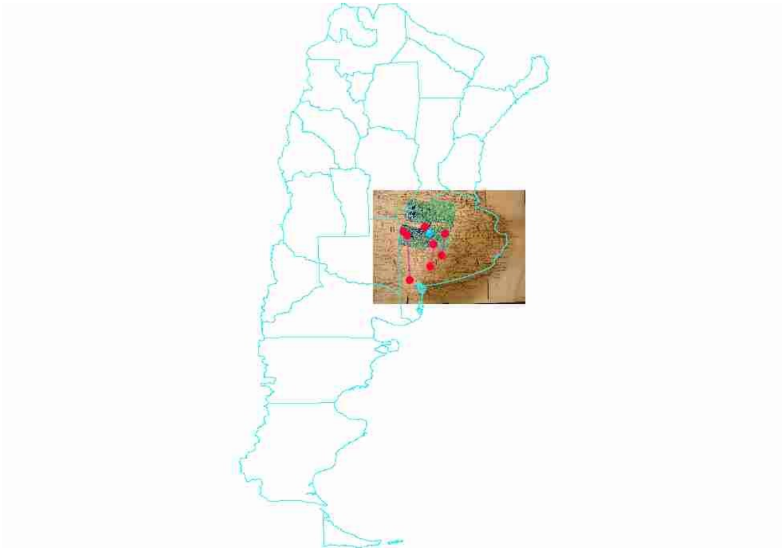
Figura 1 : Emplazamientos en Pcia de Bs As y mapa de 1911