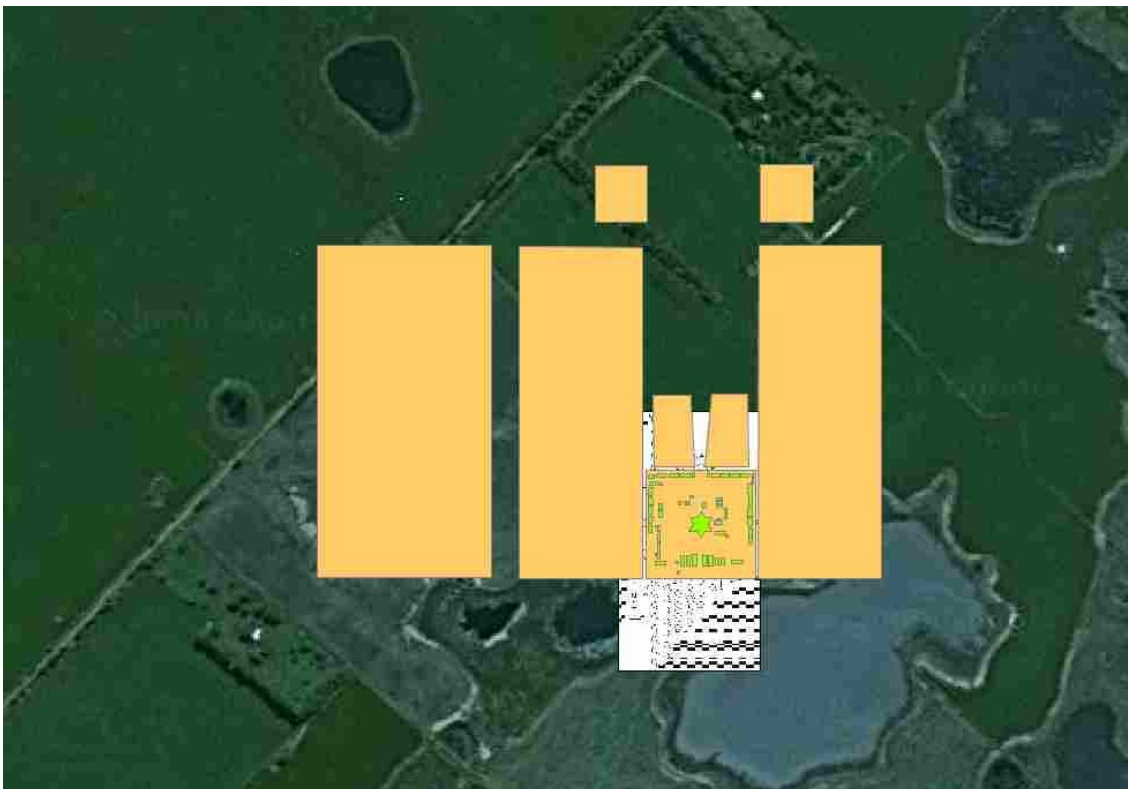
Figura 5 : Gráfico del Fuerte General Paz sobre las transectas