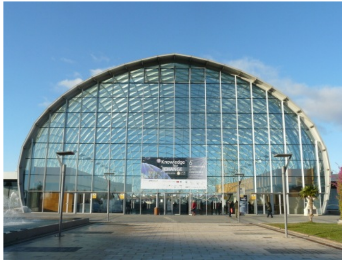
Figura 1. Lona principal de las 6as Jornadas gvSIG en la entrada del Centro de Eventos de la Feria de Muestras de Valencia