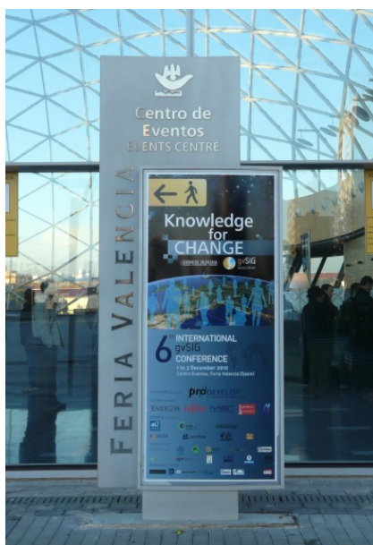
Figura 3a. 6as Jornadas gvSIG. Ejemplo de cartel colocado en la entrada del Centro de Eventos de Feria Valencia.