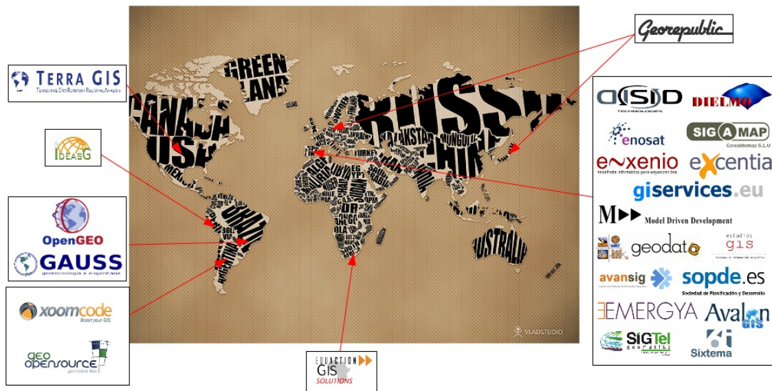
Gráfico 2. Colaboradores de la Asociación gvSIG