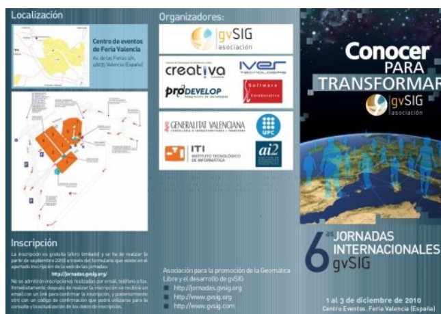
Figura 2b. 6as Jornadas gvSIG. Detalle de diseño del tríptico.