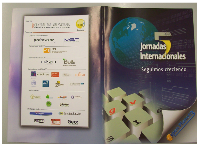
Figura 5. 5as Jornadas gvSIG. Revista Open Planet.