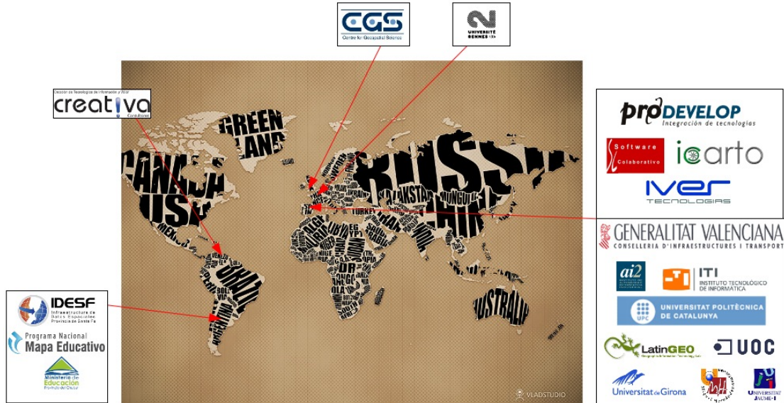
Gráfico 1. Socios de la Asociación gvSIG

Entorno a los valores democráticos y solidarios propios del Software Libre, la Asociación gvSIG plantea el desarrollo de un nuevo modelo de negocio basado en la Cooperación y el Conocimiento compartido donde parte del beneficio generado revierta en el fortalecimiento del Proyecto gvSIG.