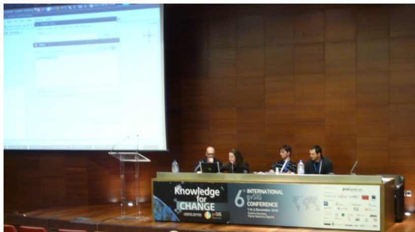
Figura 3b. 6as Jornadas gvSIG. Ejemplo de panel (“bajo mesa”) situado en la mesa central de la sala.