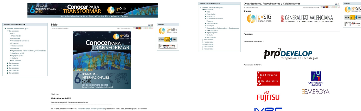
Figura 4. 6as Jornadas gvSIG. Detalles del diseño de la página Web.