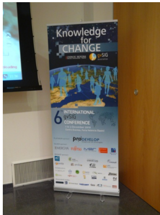
Figura 2a. Ejemplo de cartel informativo (Roll-Up) que se colocará en los distintos eventos.