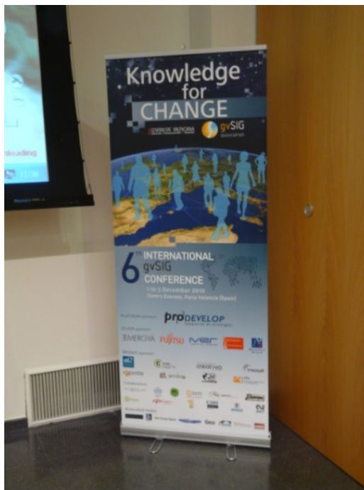
Figura 2a. Ejemplo de cartel informativo (Roll-Up) que se colocará en los distintos eventos.