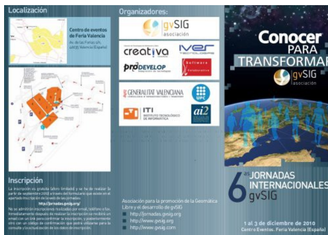
Figura 2b. Detalle de diseño del tríptico.