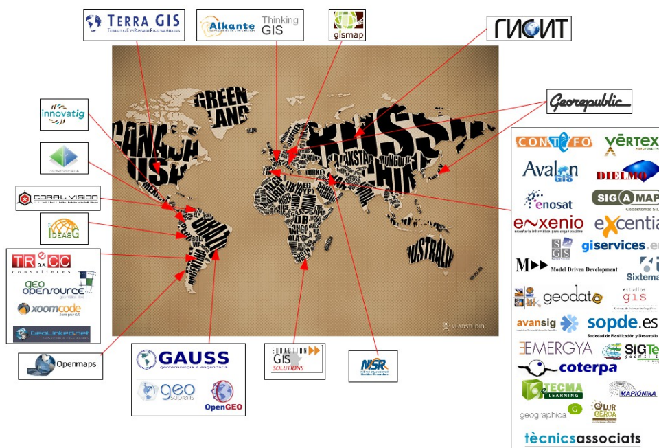
Gráfico 2. Colaboradores de la Asociación gvSIG