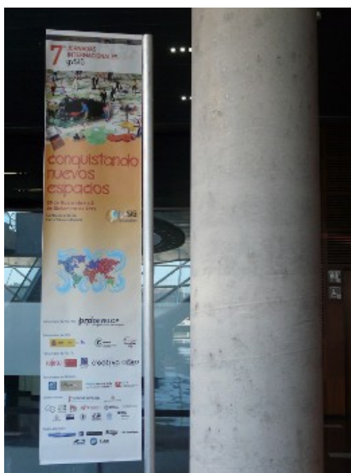
Figura 1. Ejemplo de cartel colocado en el interior del recinto.