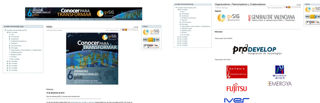
Figura 3. Detalles del diseño de la página Web.