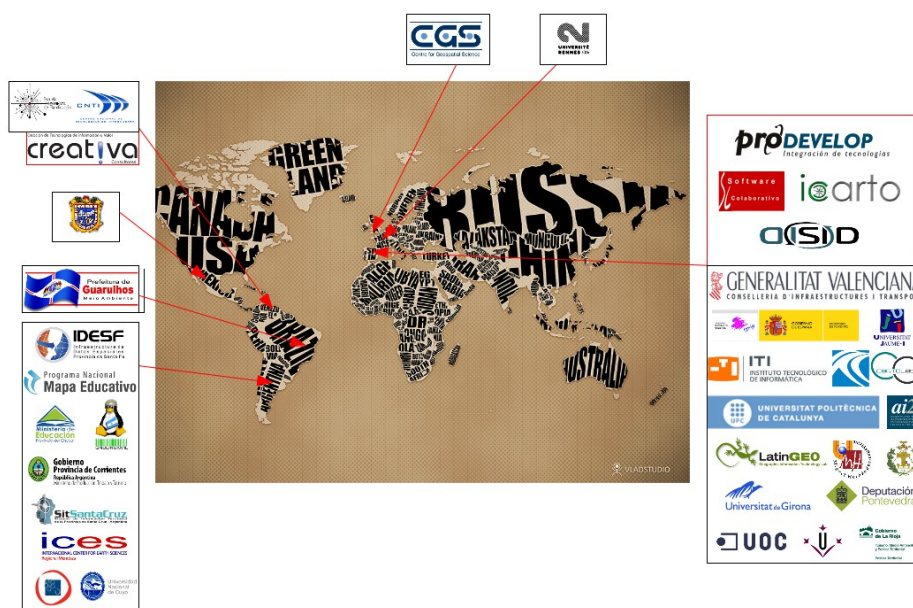
Gráfico 1. Socios de la Asociación gvSIG