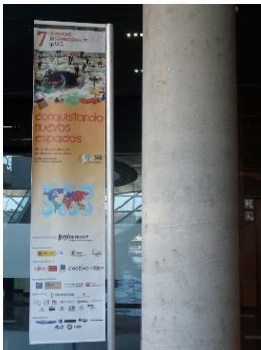
Figura 1. Ejemplo de cartel colocado en el interior del recinto.