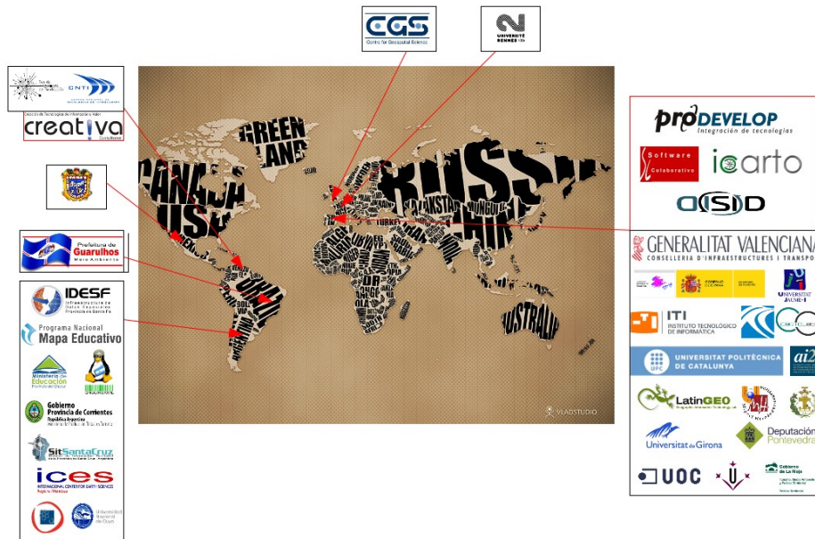
Gráfico 1. Socios de la Asociación gvSIG