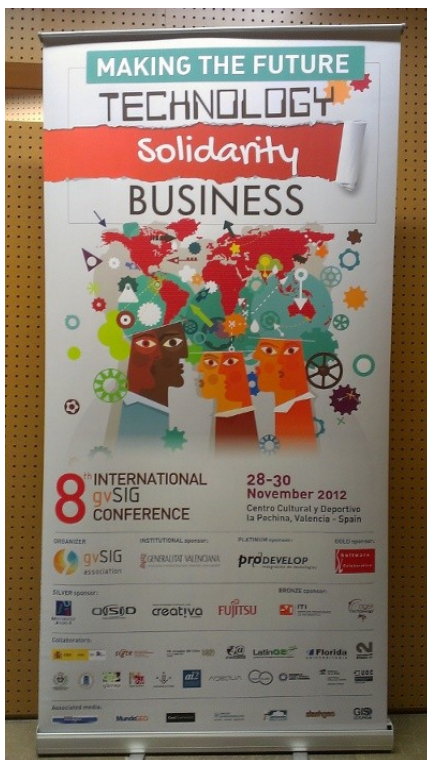
Figura 2. Ejemplo de cartel informativo (Roll-Up) que se colocará en los distintos eventos.