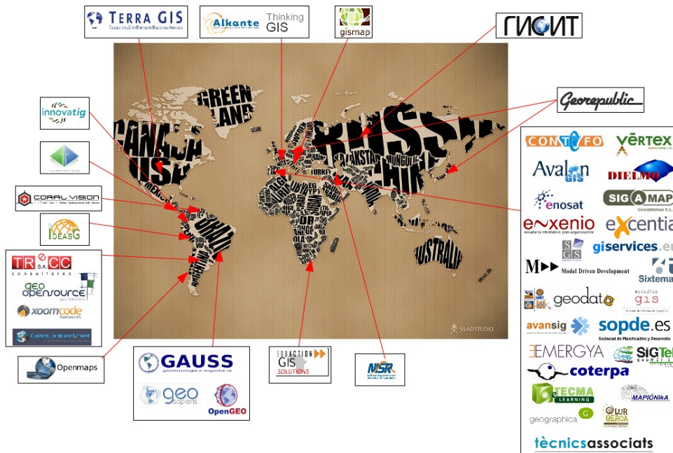
Gráfico 2. Colaboradores de la Asociación gvSIG